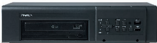
Видеорегистратор серии S2000

цифровую систему обработки и записи видеосигналов. Превосходное качество картинки (используется высокопроизводительный VGA чипсет) и разнообразные возможности управления системой (передняя панель, ИК-пульт ДУ, компьютерная «мышь», системный контроллер PSD-CJ1000) делают регистраторы серии SC2000 незаменимыми для всех объектов со специфическими требованиями к простоте установки и использования цифровых систем. Несмотря на термин «экономичные», регистраторы упомянутых серий являются современными цифровыми системами с алгоритмом сжатия MPEG-4, широкими функциональными возможностями (триплекс, поддержка SATA HDD, работа в различных сетях, управление скоростными камерами и т.д.) и высокими техническими характеристиками.