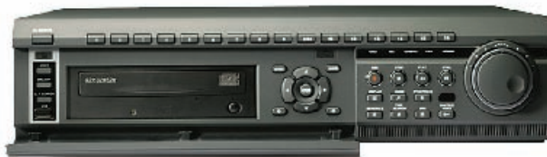
Видеорегистратор серии M6000

ство, так и совместно с регистраторами PDR с возможностью централизованного управления.