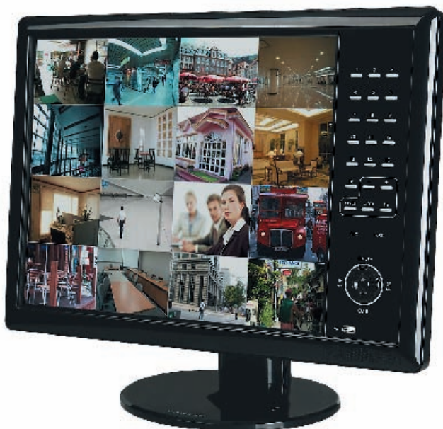
Видеорегистратор серии SC2000

Компанией Pinetron производится широкая номенклатура цифровых систем модельного ряда PDR, позволяющая подобрать регистраторы с оптимальными характеристиками для системы видеонаблюдения практически любой сложности. Экономичные цифровые системы представлены следующими моделями: PDR-S1004V, серии S2000, SJ2000 и SC2000. Регистратор PDR-S1004V является бюджетным 4-канальным рекордером, предназначенным для работы в качестве центрального устройства в самых простых системах видеоконтроля. Серии S2000 и SJ2000 включают 4-, 8- и 16-канальные модели и позволяют создавать недорогие, высокоэффективные системы видеонаблюдения различной архитектуры. Особого внимания заслуживает серия регистраторов SC2000, также представленная 4-, 8- и 16-канальными версиями. Цифровые системы этой серии представляют собой интегрированные устройства, объединяющие 19-дюймовый LCD-монитор высокого разрешения и триплексную