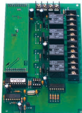
Релейный модуль СФ-РМ3004