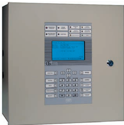
Системный блок СФ-2001-1.24

ции и лифтами и так далее используются релейные модули СФ-РМ3004. Релейный модуль содержит 4 реле, коммутирующие своими контактами цепи переменного тока 7 А с напряжением до 270 В. Каждое реле функционирует независимо от остальных и работает по своему собственному алгоритму. При программировании для реле задается задержка срабатывания, длительность работы, постоянный или импульсный режим. Прибор «Сфера 2001» позволяет включать/выключать реле по срабатыванию одного или двух извещателей в группе (в пожарной зоне), а также по сигналу от любого шлейфа сигнализации. Очень удобной функцией является ручное управление каждым реле непосредственно с системного пульта. Эта возможность позволяет легко реализовать требования п. 12.4 СНиП 41-01-2003 по дистанционному управлению клапанами дымозащиты и огнезадерживающими клапанами непосредственно из помещения диспетчерской.