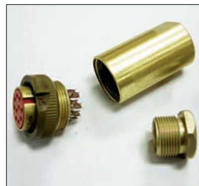
Разъем РС-10 Розетка. Распаивается на кабель. Корпус заполняется герметиком

уже будет отличным от описанного выше. Например, гермобокс для взрывоопасных помещений категории «А» требует дополнительного достаточно мощного крепления разъемного соединения и дополнительной герметизации, ибо должен выдерживать избыточное давление в 12 атмосфер (изнутри). Техническое воплощение такого требования представлено на рис. 4. Само соединение обеспечивается все тем же разъемом РС-10. Однако приходится изго-