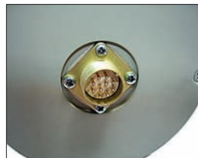
Разъем РСГ-10 Вилка Устанавливается на гермобокс